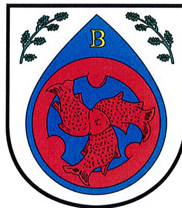
Herb Gminy Bierznik

Gmina Bierznik położona jest w południowej części województwa zachodniopomorskiego, w Powiecie Choszczeńskim. Gmina Bierznik sąsiaduje z następującymi gminami: Choszczno, Drawno, Krzęcin oraz Dobiegniew i Strzelce Krajeńskie. Powierzchnia gminy wynosi 239 km 2 . Gmina charakteryzuje się dużą lesistością, gdyż lasy wynoszą 52,3% jej powierzchni (stanu na dzień 1 stycznia 2019 r.). Lasy tworzą dwa kompleksy, w tym północny Puszczy Drawskiej. Z kolei użytki rolne zajmują 36,3% powierzchni gminy. Ludność Gminy Bierznik wynosi ogółem 4 724 mieszkańców 27 , a zaludnienie jej jest jednym z najniższych w województwie zachodniopomorskim. Łącznie ludność gminy zamieszkuje w 42 miejscowościach. W Bierzniku, jako największej jednostce osadniczej znajduje się siedziba administracji samorządowej.