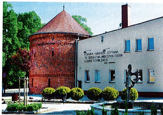
Gotycka baszta z przedbramia Bramy Kamiennej (potocznie zwana barbakanem, róg ul. Piastowskiej); fot. UM w Choszczynie.

Mury miejskie i barbakan. Mury obronne pochodzą z XIV i XV wieku. W ich ciągu usytuowane były trzy bramy, siedem baszt i 36 czatowni, a obwarowania wzmacniał podwójny system wałów i fos. Bramy znajdowały się przy głównych wjazdach do miasta: Brama Kamienna prowadziła w kierunku Barlinka i Myśliborza, Brama Młyńska w kierunku Stargardu, natomiast Brama Wysoka w kierunku Dobiegniewa. W XV i XVI wieku rozbudowano je o tzw. przedbramia i choć mury, które utraciły swój walor obronny, rozbierano już od XVIII wieku, to jednak do dzisiaj zachowały się ich fragmenty, w tym jeden z piękniejszych zabytków, czyli gotycka baszta z przedbramia Bramy Kamiennej (potocznie zwana barbakanem, róg ul. Piastowskiej i Wolności). Zniszczona w czasie II wojny światowej została odbudowana w 1961 r.