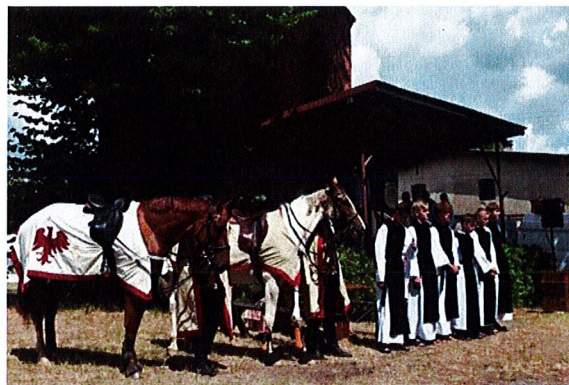
W dniach 11-14 lipca 2019 r. na Wzgórzu Klasztornym w Bierzwniku odbyły się IX Międzynarodowe Targi Wyrobów Klasztornych organizowane podczas cyklicznego wydarzenia „3 DNI NA CYSTERSKIM SZLAKU”

Od 2008 r. w Bierzwniku, w połowie lipca organizowana jest cykliczna impreza kulturalna pod hasłem „3 Dni na Cysterskim szlaku”. Jest to festyn historyczny organizowany przez Urząd Gminy w Bierzwniku, nawiązujący do cysterskich korzeni Bierzwnika. W programie znajdują się m.in.: koncerty dawnej muzyki cysterskiej, występy artystyczne, zawody łucznicze, pokazy walk rycerskich i obyczajów rycerzy średniowiecznych, pokazy rękodzielników, konkursy i zabawy dla dzieci, zabawa taneczna. W ramach imprezy organizowane są również „Targi Wyrobów Klasztornych”, które mają charakter międzynarodowy i służą wymianie doświadczeń, poznawaniu nowych smaków i kultywowaniu tradycji kulinarnych. Impreza promuje ideę szlaku cysterskiego, nie tylko w aspekcie turystycznym, ale i kulturalnym. Jest to ciekawa oferta kulturalna nie tylko dla mieszkańców gminy Bierzwnik, ale ze względu na okres wakacyjny, również dla turystów przebywających w tym czasie na terenie gminy.