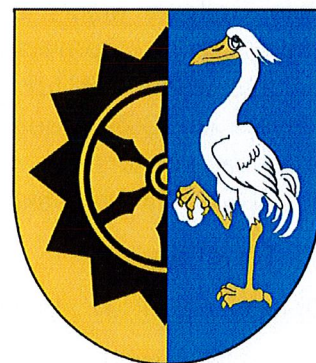
Herb Miasta i Gminy Drawno

Gmina Drawno to gmina miejsko – wiejska położona we wschodniej części Powiatu Choszczeńskiego. Obszar gminy Drawno sąsiaduje z następującymi gminami: od strony północnej z gminą Kalisz Pomorski, północno – zachodniej z gminą Recz, od zachodu z gminą Choszczno, a od południa z gminami: Bierzwnik i Dobiegniew (województwo lubuskie). Teren gminy ma równoleżnikowy, wydłużony kształt, obejmujący powierzchnię 321 km 2 położoną pomiędzy 15.37 – 16.02 długości geograficznej wschodniej i 53.07 – 53.19 szerokości geograficznej północnej. Przez gminę Drawno prowadzi droga krajowa nr 10 w jej północnej części, łącząca Kalisz Pomorski z Reczem oraz droga wojewódzka nr 175, łącząca Drawno z Kaliszem Pomorskim (14 km) i Choszcznem (24 km).