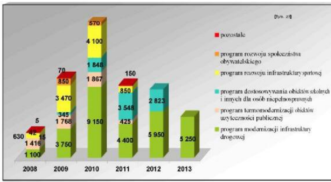
Wykres nr 2. Wielkość nakładów ogółem na realizację poszczególnych programów

Wykres nr 2 ilustruje wielkość nakładów niezbędnych do realizacji wyodrębnionych programów opracowanych na potrzeby WPI dla powiatu choszczeńskiego (łącznie ze wszystkimi źródłami finansowania).