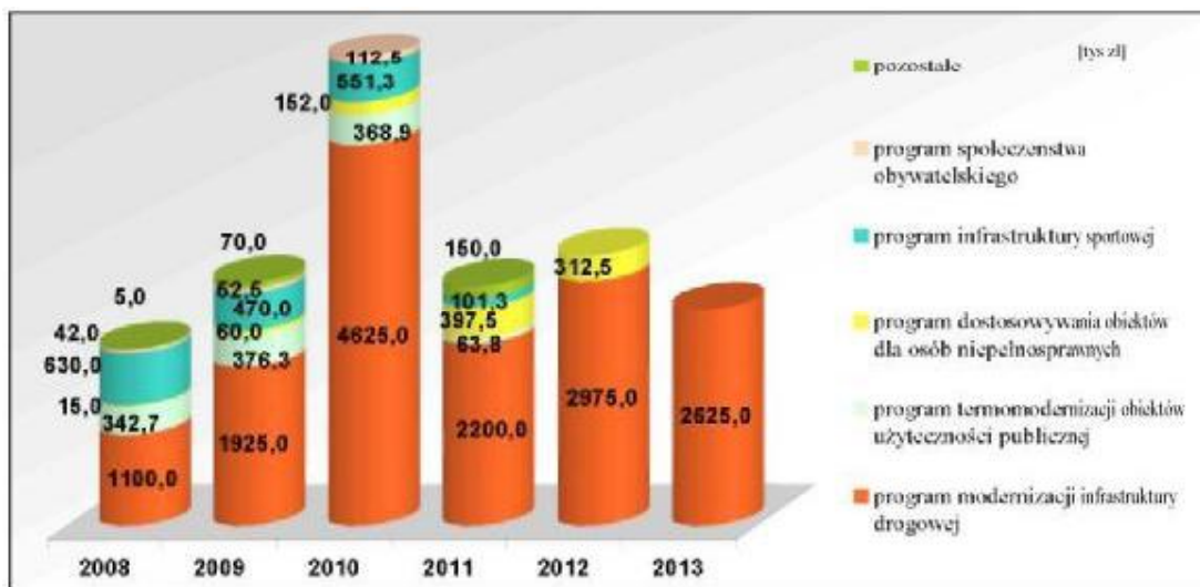
Wykres 3. Wielkość nakładów inwestycyjnych pochodzących ze środków budżetowych powiatu na realizację poszczególnych programów

Zadania zawarte w WPI zostały przypisane poszczególnym komórkom odpowiedzialnym za przygotowanie lub realizację przedsięwzięcia. Poniżej przedstawiono prognozowane wielkości nakładów przez poszczególne komórki Powiatu.